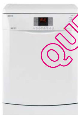
Existe en Blanc (DFN6835) Code EAN : 8 690 842 359 743