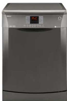
Existe en Anthracite (DFN6835B) Code EAN : 8 690 842 359 750

Grâce au Mini LCD, sur le même écran suivez le déroulement des programmes, le temps restant et le départ différé 0-24 heures.